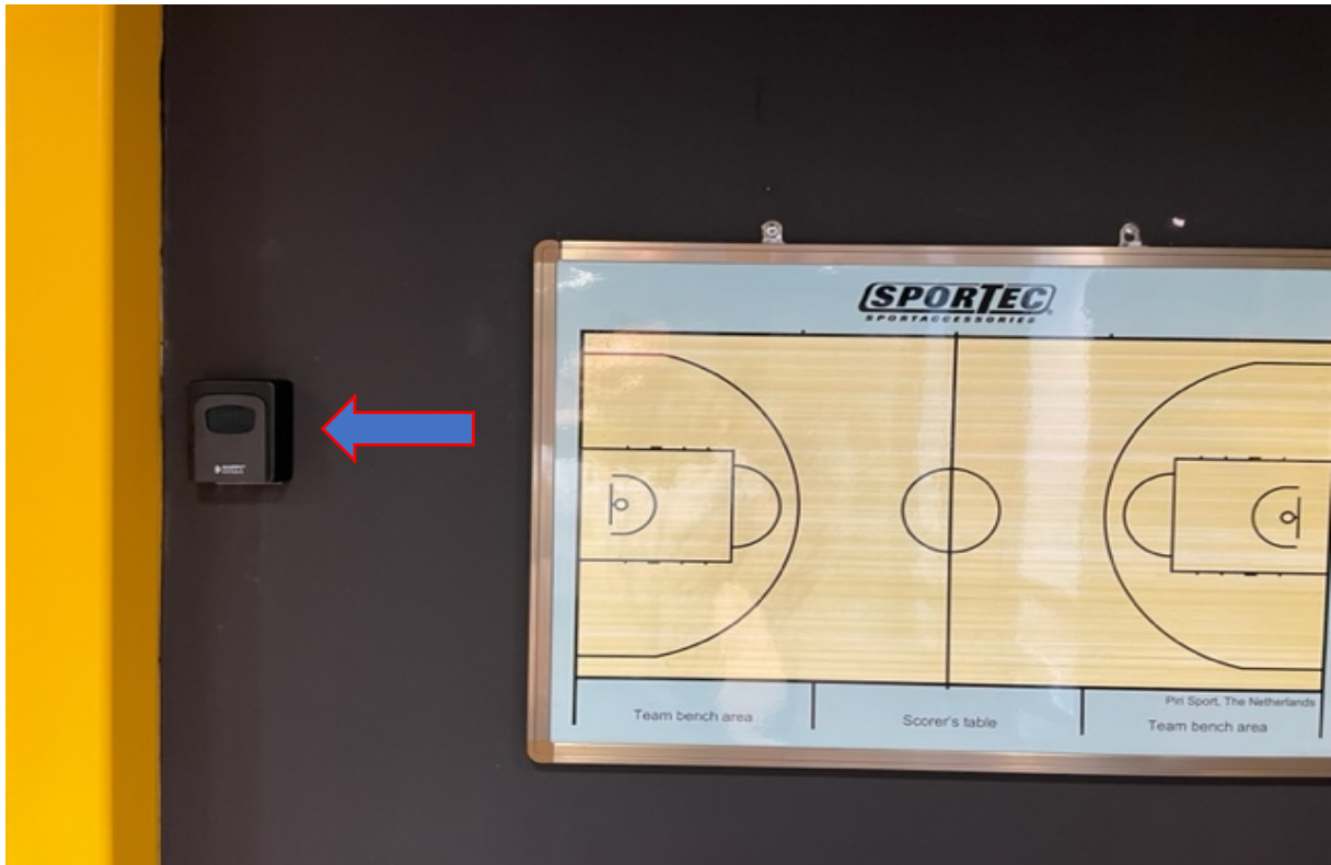
Positie sleutelkluisje in de vissenkomp.