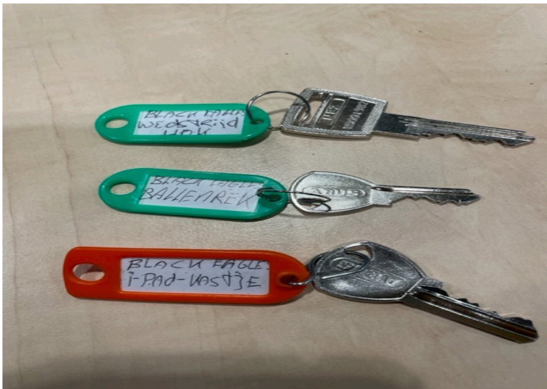
Aanwezige sleutels in het sleutelkastje.