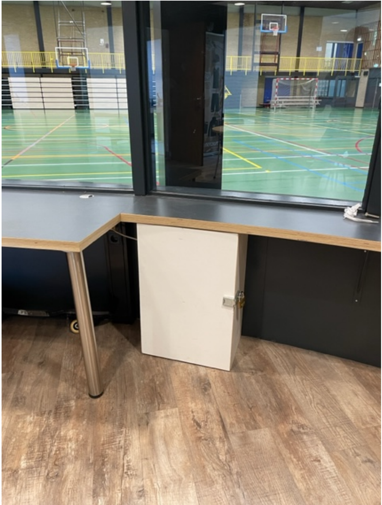
Kastje met tablets in de vissenkomp.